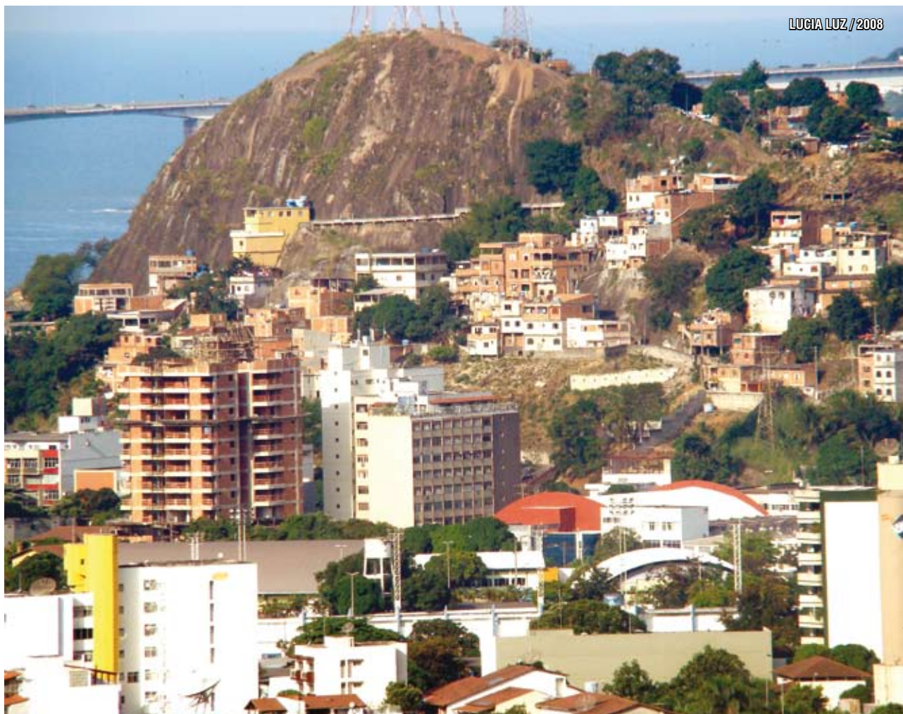
Vista panorâmica de Vitória