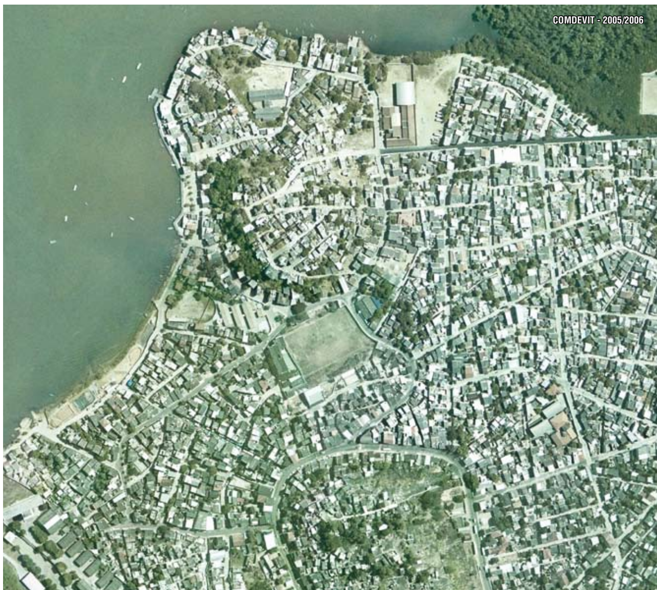
Ortofoto de São Pedro - Vitória