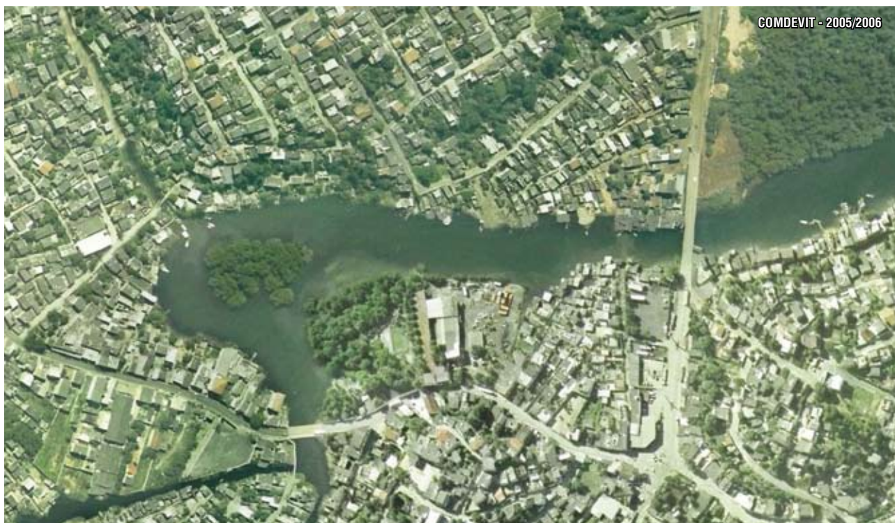
Ortofoto de parte da bacia do Rio Aribiri - Vila Velha