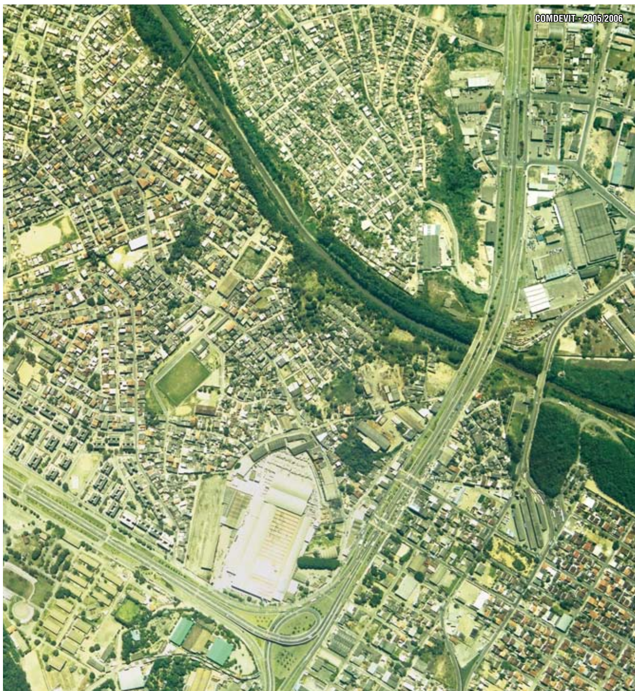
Ortofoto de Carapina - Serra