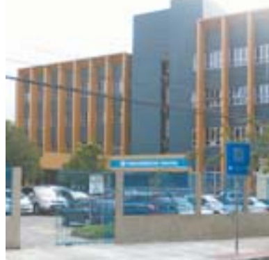
FACHADA DO INSS: benefícios