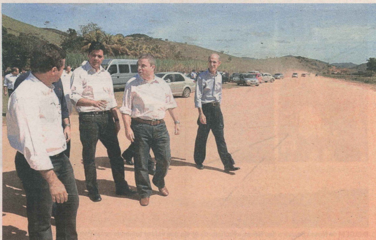
REPRESENTANTES do Estado e de Minas visitam aeroporto que possui pista de terra batida com 1 km de extensão

O anúncio foi feito ontem durante solenidade em Barra de São Francisco. De acordo com Ferraço, o aeroporto será um instrumento importante para o desenvolvi-