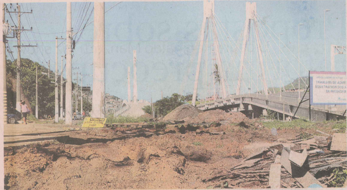
PRAZO. Urbanização dos acessos depende da retirada de uma tubulação da Cesan do local

Para passar pela passarela da Ponte da Passagem, os pedestres têm que enfrentar lama e lixo