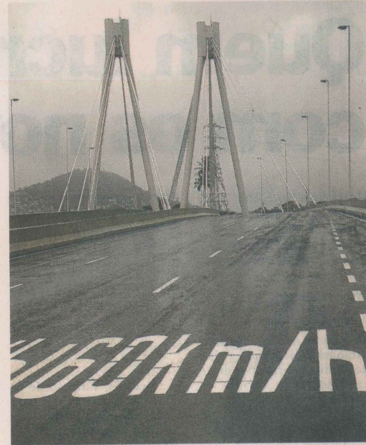
VELOCIDADE MÁXIMA. O limite de 60 km/h está sinalizado

Obra será inaugurada neste domingo; mas passarela só começa a ser construída no próximo mês