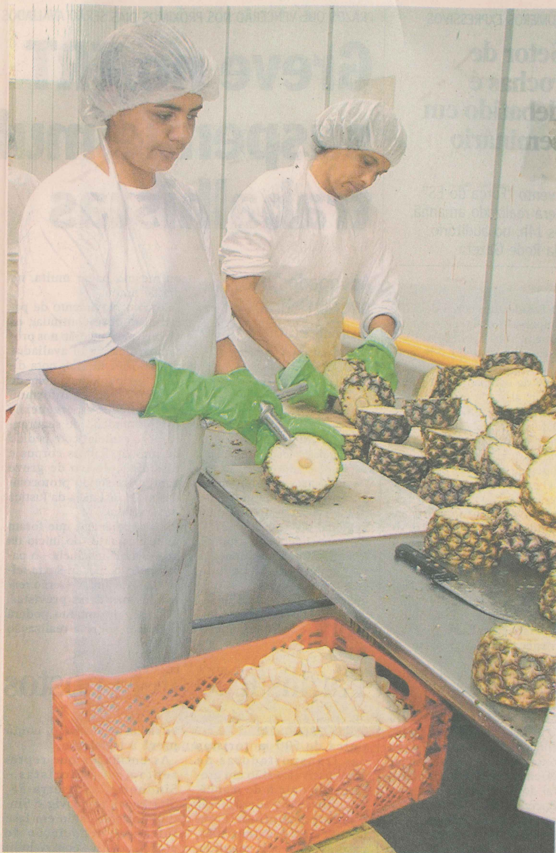
EM ALTA. Produção de abacaxi no Sul do Espírito Santo: para a fruticultura, de uma maneira geral, a situação é favorável porque o consumo no mercado interno está aquecido.