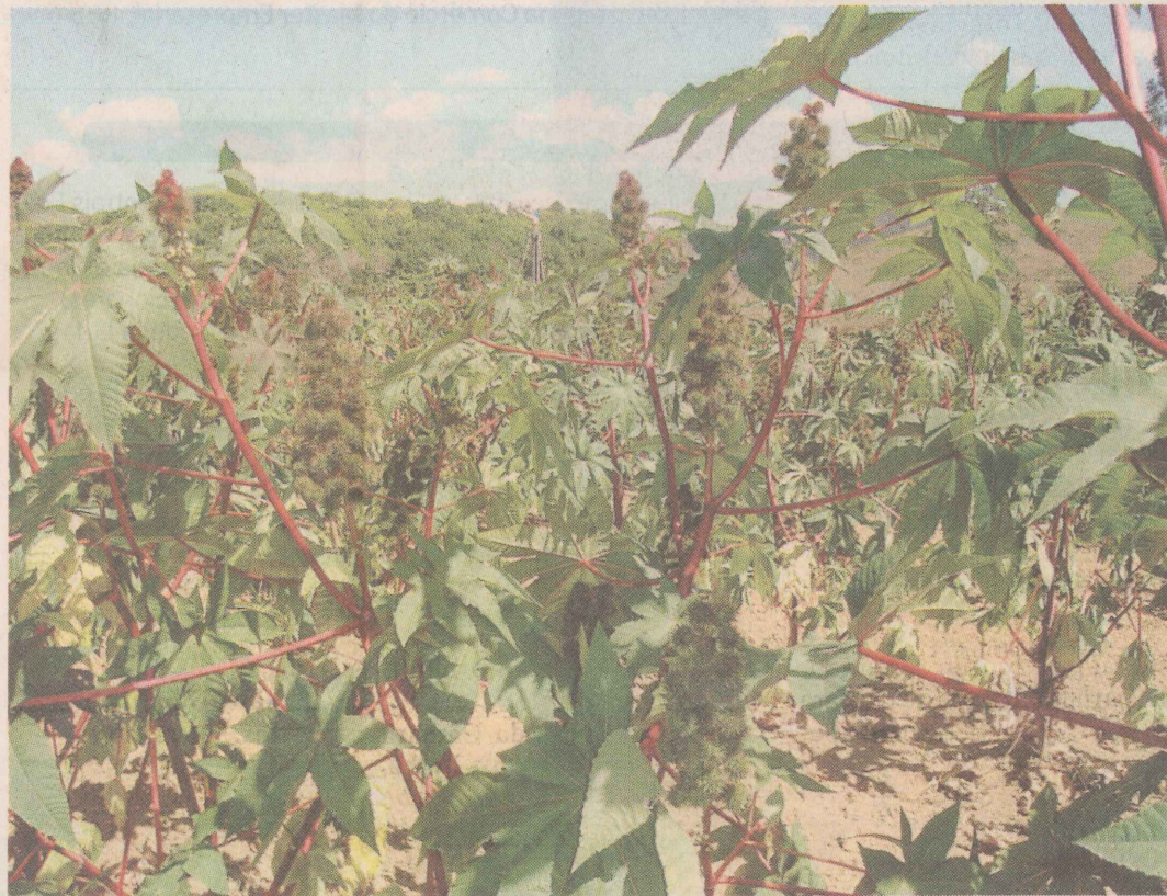
NA FRENTE. A Fazenda Experimental da Incaper, em Viana, já produz girassol, mamona e pinhão manso para geração de biocombustíveis.

A segurança alimentar é outro tema de destaque do evento. As estimativas indicam que em 2025, para alimentar mais 2 bilhões de pessoas no mundo, serão necessárias mais 4 bilhões de toneladas de alimentos. E, mais uma vez, entra a participação do agrônomo, com a missão de orientar os