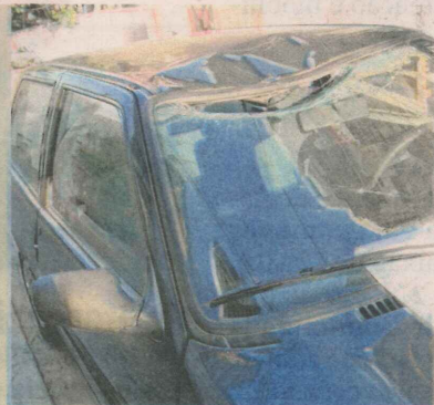
CARRO ficou danificado

A peça de um andaime caiu de uma obra em Jardim Camburi, Vitória, em cima de um Fiat Uno, na tarde de ontem, afundando o teto do veículo e quebrando o pára-brisa dianteiro. A Polícia Militar registrou a ocorrência. O responsável pela obra deixou um bilhete em cima do carro com o seu telefone, informando que pagaria o prejuízo.