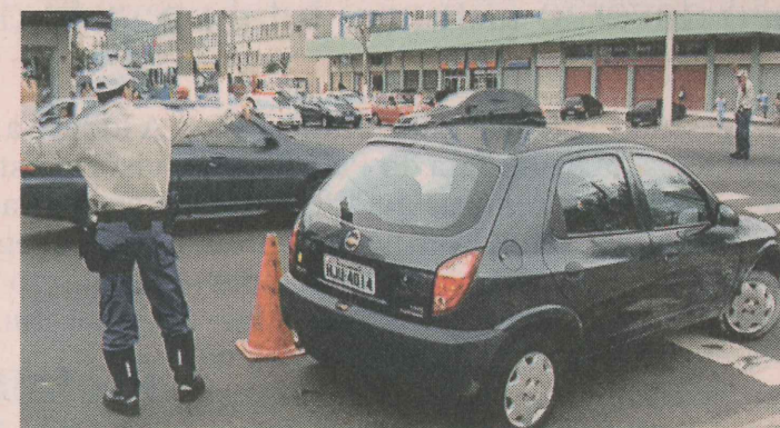
ABORDAGEM. A dupla só acordou após a chegada da guarda