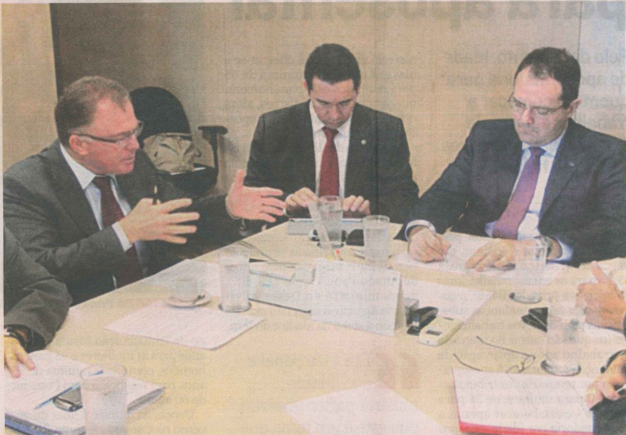
GOVERNADOR Casagrande e secretário executivo do Ministério da Fazenda, Nelson Barbosa, (à direita) em reunião