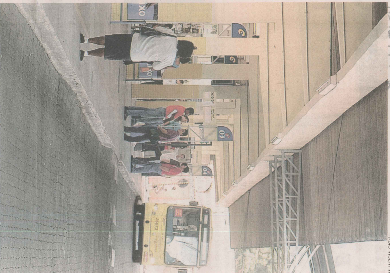
O Terminal de Carapina será reformado e passará a funcionar 24 horas

Conclui ampliação da via, com mais faixas e corredores exclusivos