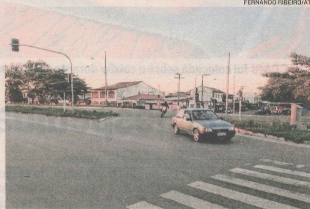
RODOVIA DARLY SANTOS, próximo ao bairro Araçás, onde serão construídos os viadutos