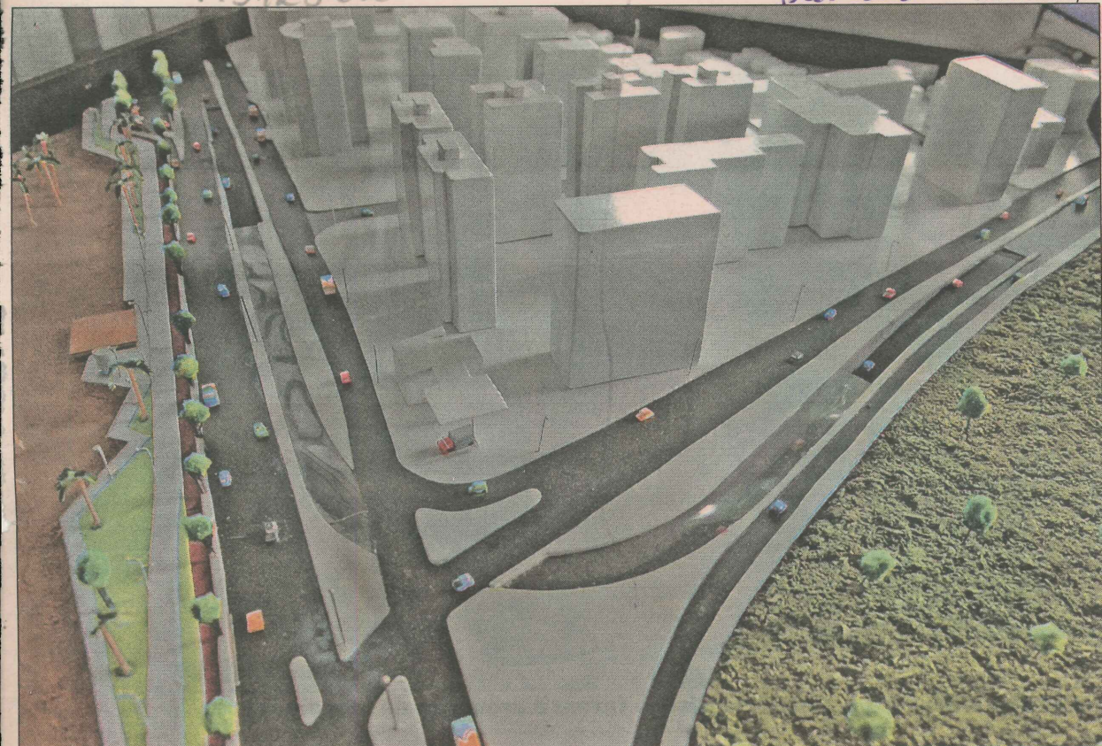
Maquete mostra como será entrocamento da Dante Michelini e Adalberto Simão Nader