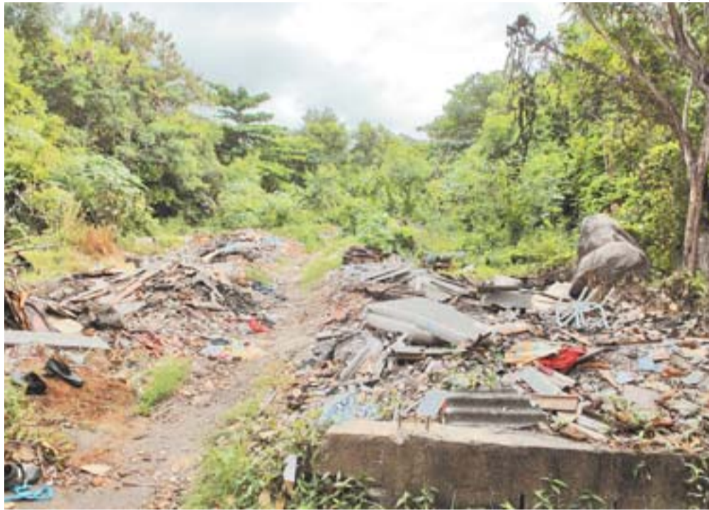
GRANDE quantidade de entulho e lixo está sendo depositada na área do parque

“Pedimos providências por parte das autoridades, não apenas quanto à limpeza, mas, principalmente, por uma ação de conscientização junto aos moradores do entorno da área”.