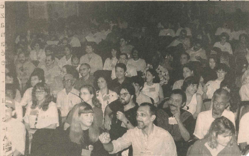
A Conferência Estadual de Segurança Alimentar foi encerrada ont