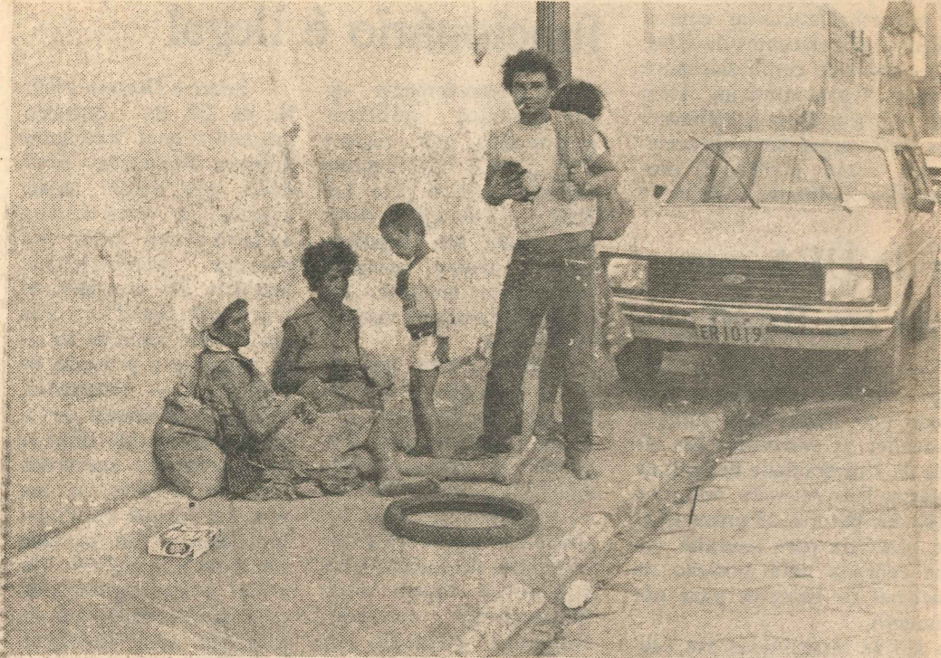
As famílias deixam o interior com esperança de melhorar a vida na capital