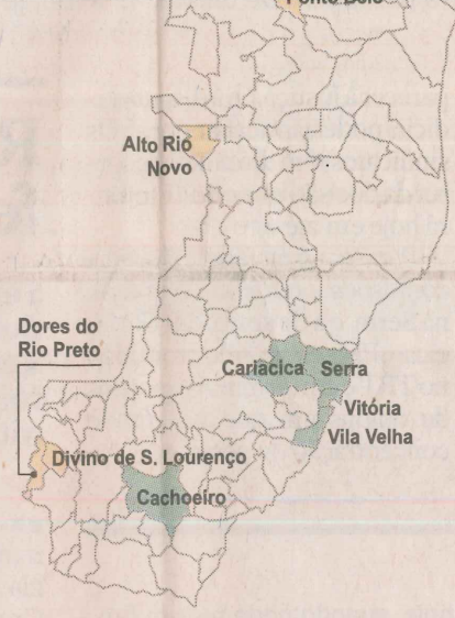
A Gazeta - Ed. de Arte - Gilson