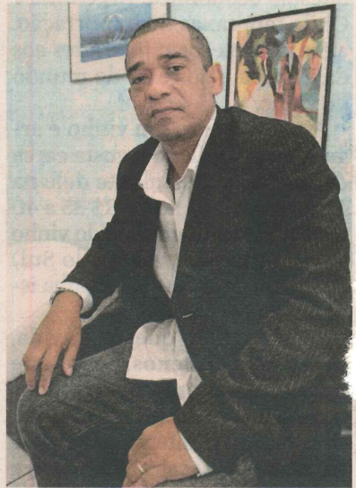
SANTOS: conquista feminina