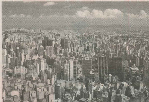
SÃO PAULO mantém o posto de cidade mais populosa do Brasil, com mais de 11 milhões de habitantes

O levantamento do IBGE é utilizado como parâmetro para a distribuição de recursos federais do Fundo de Participação de Estados e Municípios.