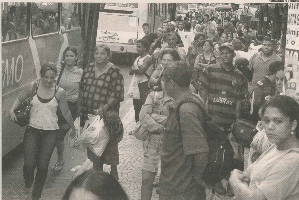
A POPULAÇÃO de Vila Velha aumentou de 407,5 mil para 413,5 mil entre 2008 e 2009, segundo o IBGE