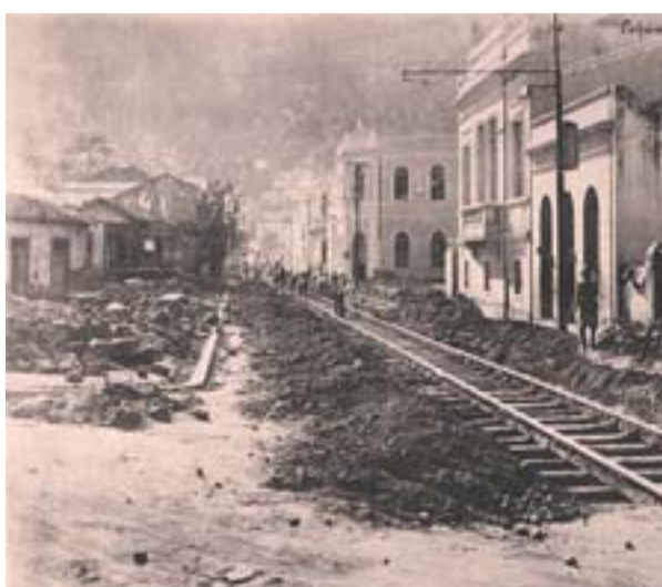
A PAVIMENTAÇÃO e calçamento da rua Sete de Setembro foram feitos no início do século passado. Também já contava com os trilhos por onde ia passar a seguir o bonde.

O BONDE era o principal transporte de Vitória. Ele passava pela Rua Sete e tinha trajeto levando passageiros para vários locais, como Praia do Canto, Vila Rubim e Jerônimo Monteiro. Os primeiros bondes eram do tipo locomotiva movido a carvão. Eles permaneceram na capital até meados da década de 1960.