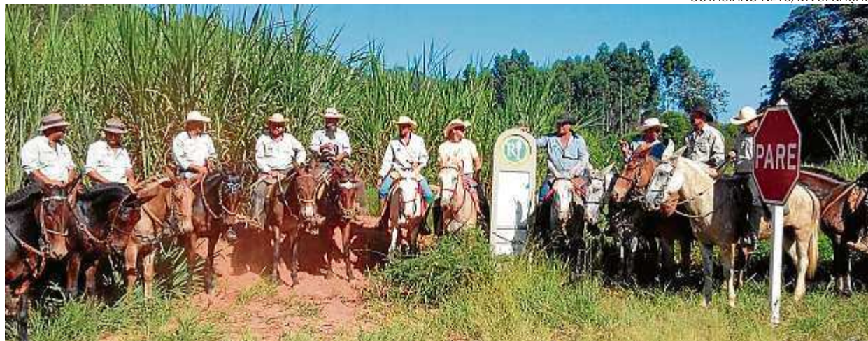
Em mulas e burros, os amigos aproveitam as paradas ao longo da viagem para registrar os momentos