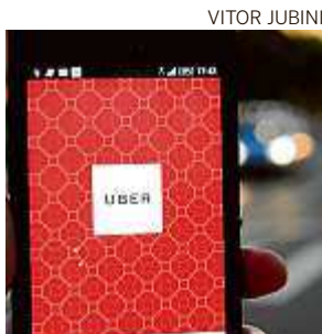
O aplicativo ainda não funciona em Vitória

A empresa Uber reiterou que não opera na cidade, mas celebra o fato de Vitória buscar construir um ambiente regulatório que promova a inovação.