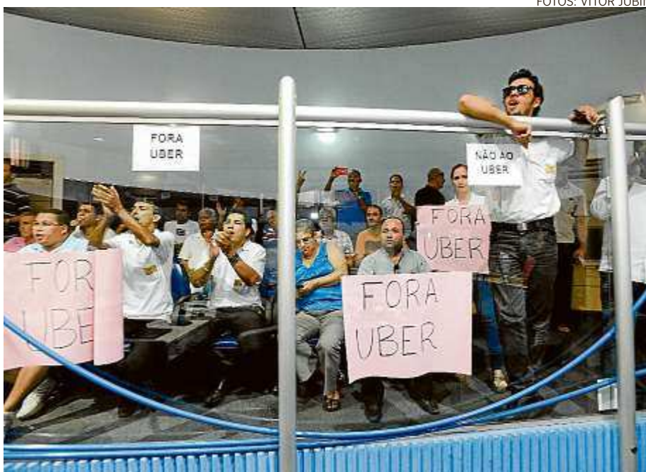
A votação foi realizada mediante a pressão de taxistas que lotaram a galeria