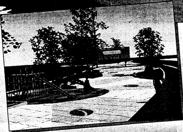
Projeto de Nova Palestina