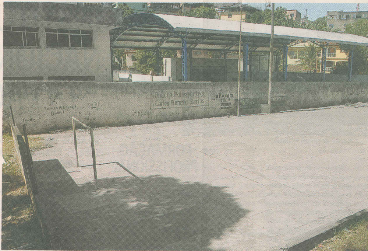
ABANDONO. A quadra de esportes do bairro está abandonada.

TOME NOTA: Amanhã, publicaremos os orgulhos de Alto Lage. E no sábado, o mapa do bairro.