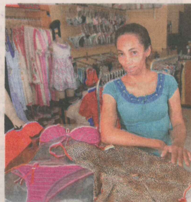
ADILMA tem loja há 7 anos