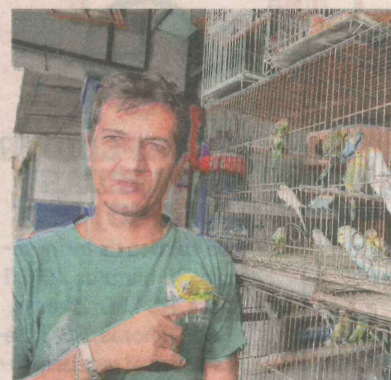
BENÔNIO: produtos para animais

A loja está com uma promoção de periquitos australianos, já que tem mais de 100 animais disponíveis na loja: um custa R$ 15, e dois, R$ 25.