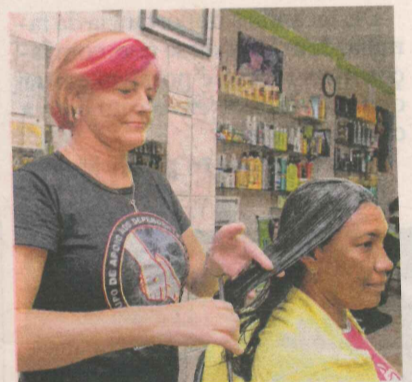
PENHA: salão segue tendências

Penha acompanhou o crescimento de muitas moradoras, que frequentam o salão desde crianças. “Há mulheres que se arrumaram aqui quando foram damas, debutantes e noivas.”