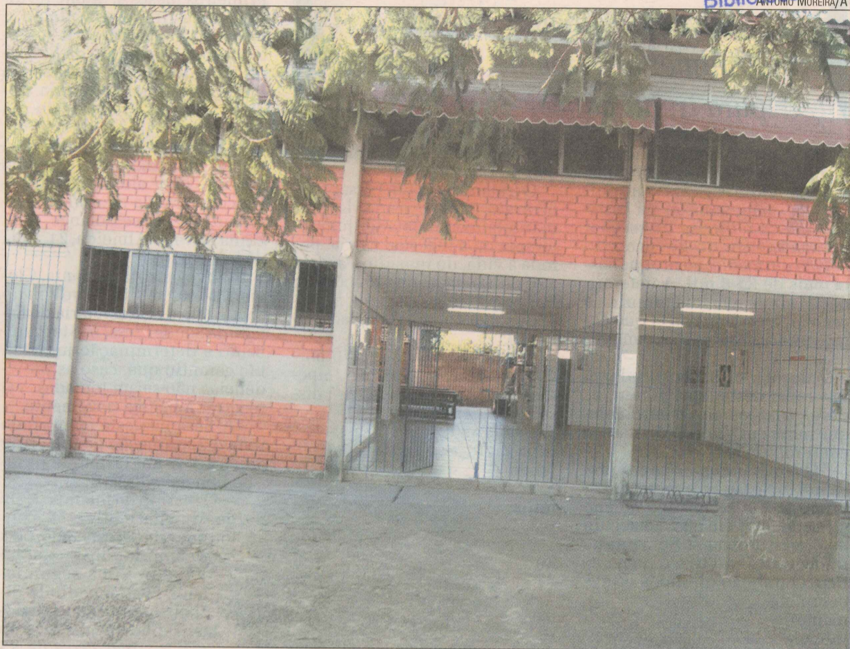
A Escola Joana Maria abrirá nos finais de semana para cursos e atividades esportivas

Os idosos do bairro participam de atividades do Grupo de Terceira Idade, que se reúne na sede da Associação de Moradores. O local também recebe a equipe da Pastoral da Criança, uma vez por mês. Pais levam os filhos para a medição do peso e acompanhamento sempre no último sábado de cada mês.