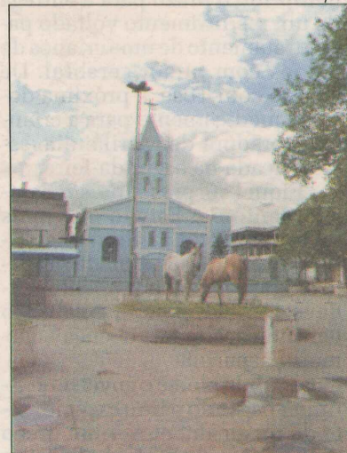
Cavalo na praça de Bela Aurora