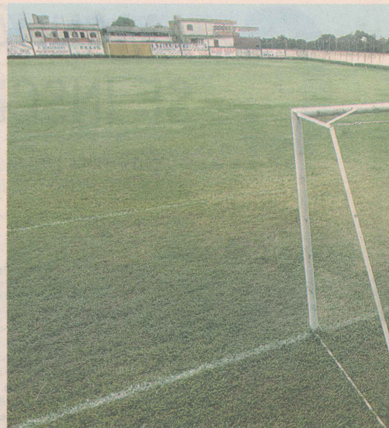
PALCO. Todos os sábados e domingos, são realizadas partidas de futebol.

Esse é o valor total do patrimônio do Esporte Clube Siderúrgico, time de futebol do bairro de Bela Aurora. O time tem um estádio que já serviu para tudo: de salas de aula para estudantes do primeiro grau a pista de pouso para helicóptero do governo do Estado.