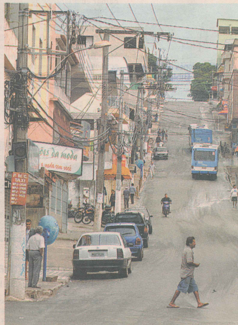
PÚBLICO. A estrutura comercial da Av. Espírito Santo atende aos moradores de Esperança, Ipiranga e Caramuru, entre outros bairros.

Instituto Jones dos Santos Neves Biblioteca