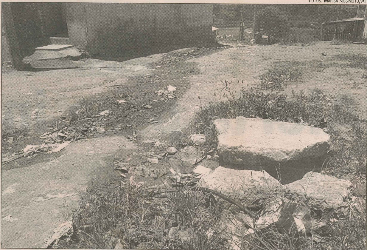
Rua São Rafael, onde esgoto atrai insetos e não há pavimentação

Em relação à rua São Rafael, o secretário esclareceu que as manilhas já estão sendo providenciadas para que a canalização seja concluída. A previsão é de que os trabalhos comecem até o final desta semana.