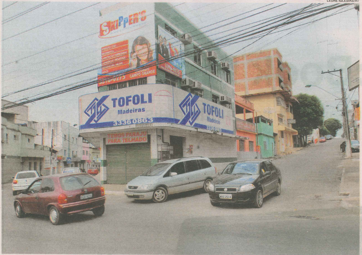
RUA BOM PASTOR , em Campo Grande, vai passar a funcionar em sentido contrário a partir de amanhã