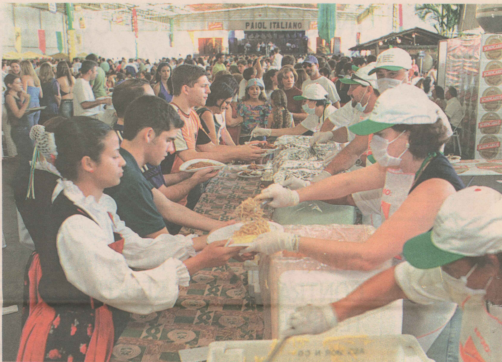
PÚBLICO. Segundo organizadores, o encontro é uma das maiores festas do Estado, e chega a reunir 25 mil pessoas, durante três dias.