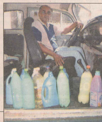
PRODUTOS DE LIMPEZA

As mercadorias são vendidas para supermercados e mercearias. Cada dúzia custa R$ 44,00, para pagamento em 30 dias. Contato: 3336-6751.