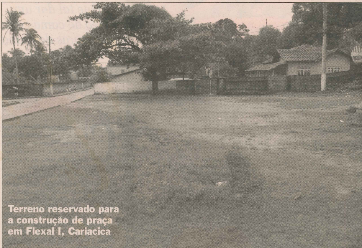
Terreno reservado para a construção de praça em Flexal I, Cariacica