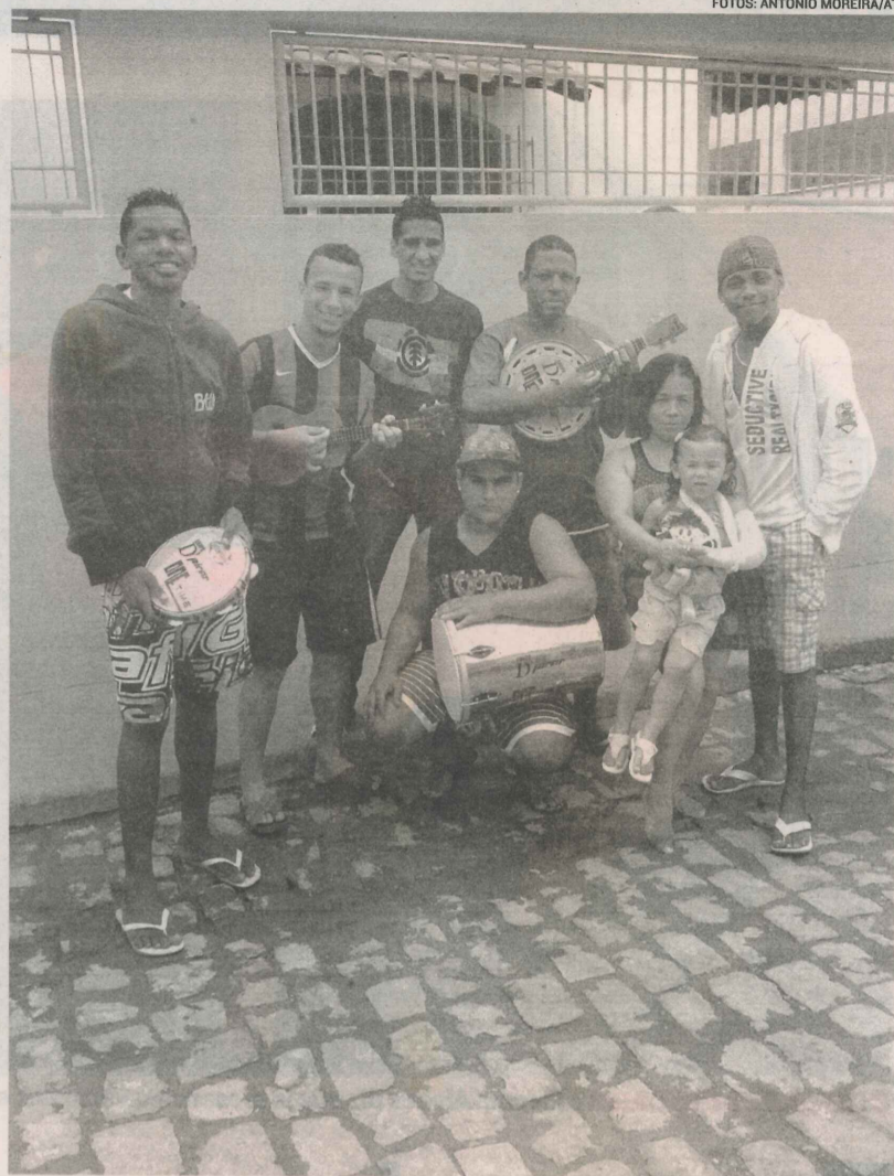
A BANDA Dpirar toca amanhã em festa na escola de samba Boa Vista

Sidney conta que o segredo para eles tem sido o comprometimento. “Queremos fazer um trabalho sério que vai nos ajudar a crescer com responsabilidade e reconhe-