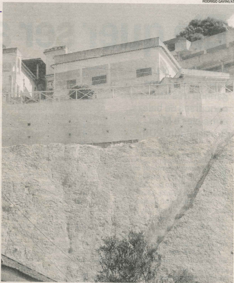
OBRA para impedir que terra ceda será entregue em setembro, diz prefeitura

“Esta obra veio até atrasada, pois a situação aqui estava muito crítica.