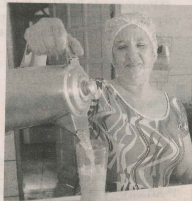
TELMA: caldo de cana