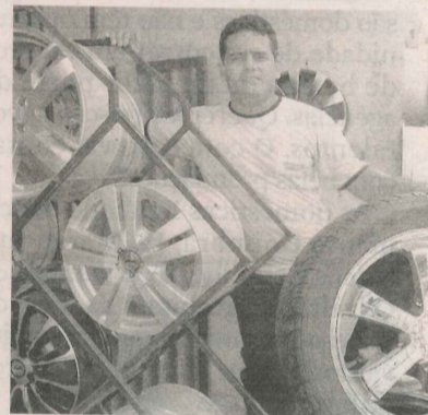
MARCILEY: novos serviços

O comerciante disse que além dos reparos de rodas e pneus vai implantar, em breve, serviços de alinhamento e balanceamento.