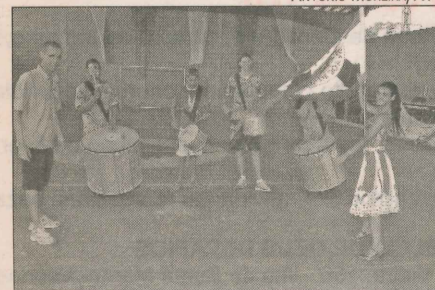
Integrantes da Boa Vista