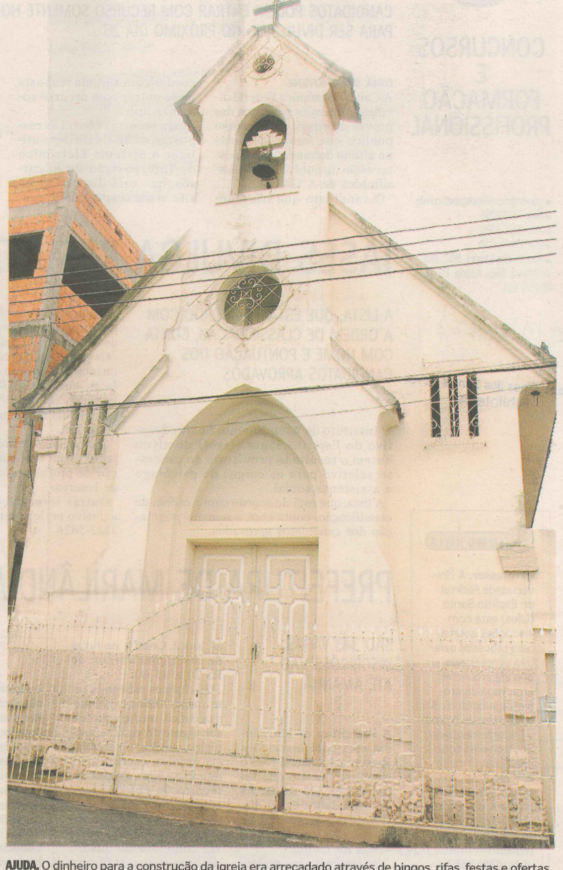
AJUDA. O dinheiro para a construção da igreja era arrecadado através de bingos, rifas, festas e ofertas.

TOME NOTA: Amanhã, confira as entrevistas com dois empresários de sucesso do bairro. E no sábado, o mapa ilustrado.