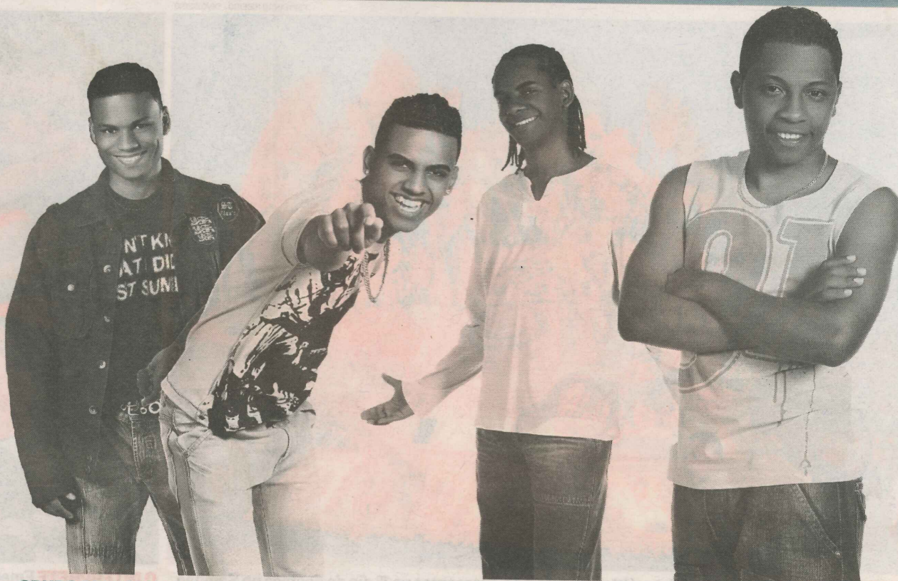
GRUPO PELE MORENA tem 12 anos de carreira e vai apresentar seus sucessos em cidades como Rio e São Paulo

"Para a turnê, temos shows marcados no Rio de Janeiro e em São Paulo, além das apresentações em programas de TV", destacou o músico.