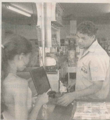
PADARIA Ki-Pão: diversidade