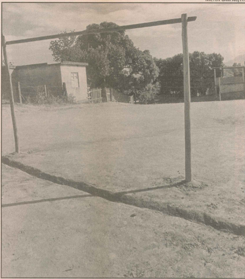
Campinho de futebol improvisado em terreno particular