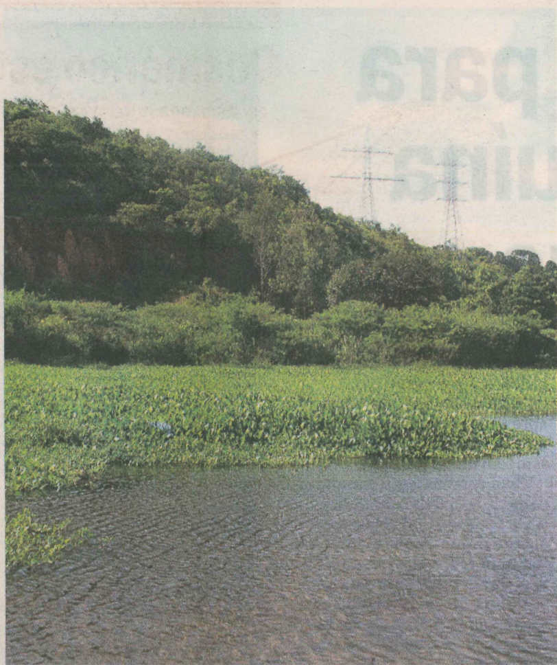
LOCAL onde será construído o Parque Municipal O Cravo e a Rosa

playground, quadra poliesportiva, campo de futebol, banheiros, trilhas ecológicas e um centro de educação ambiental à disposição dos moradores.