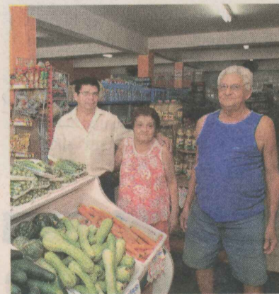
MERCEARIA virou supermercado