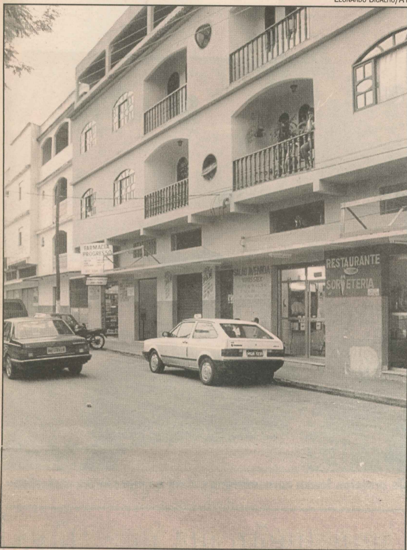
Destaque para pequenos estabelecimentos comerciais

Firme garantiu que, no ano passado, 76,2% da população de Nova Brasília não contribuíram com o Imposto Predial Urbano (IPU). Já com relação ao Imposto Territorial Urbano (ITU), as estimativas revelam 77,7% de inadimplência.