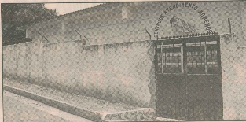
Centro de Atendimento ao Menor, onde acontecem os cursos