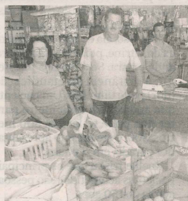
GUERINO: negócio em família

Ele afirma que faz questão de manter marcas de qualidade em sua lista de produtos.