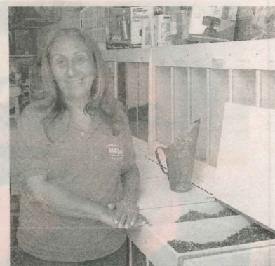
MEIRE: trabalho e vida no bairro

Na MRM rações é possível encontrar ração para cães, gatos, galinhas e pássaros.