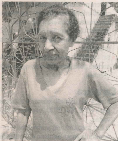
ALDIR: não existiam ruas

A aposentada continua organizando movimentos junto aos colegas do bairro lutando por melhorias para o lugar onde moram.