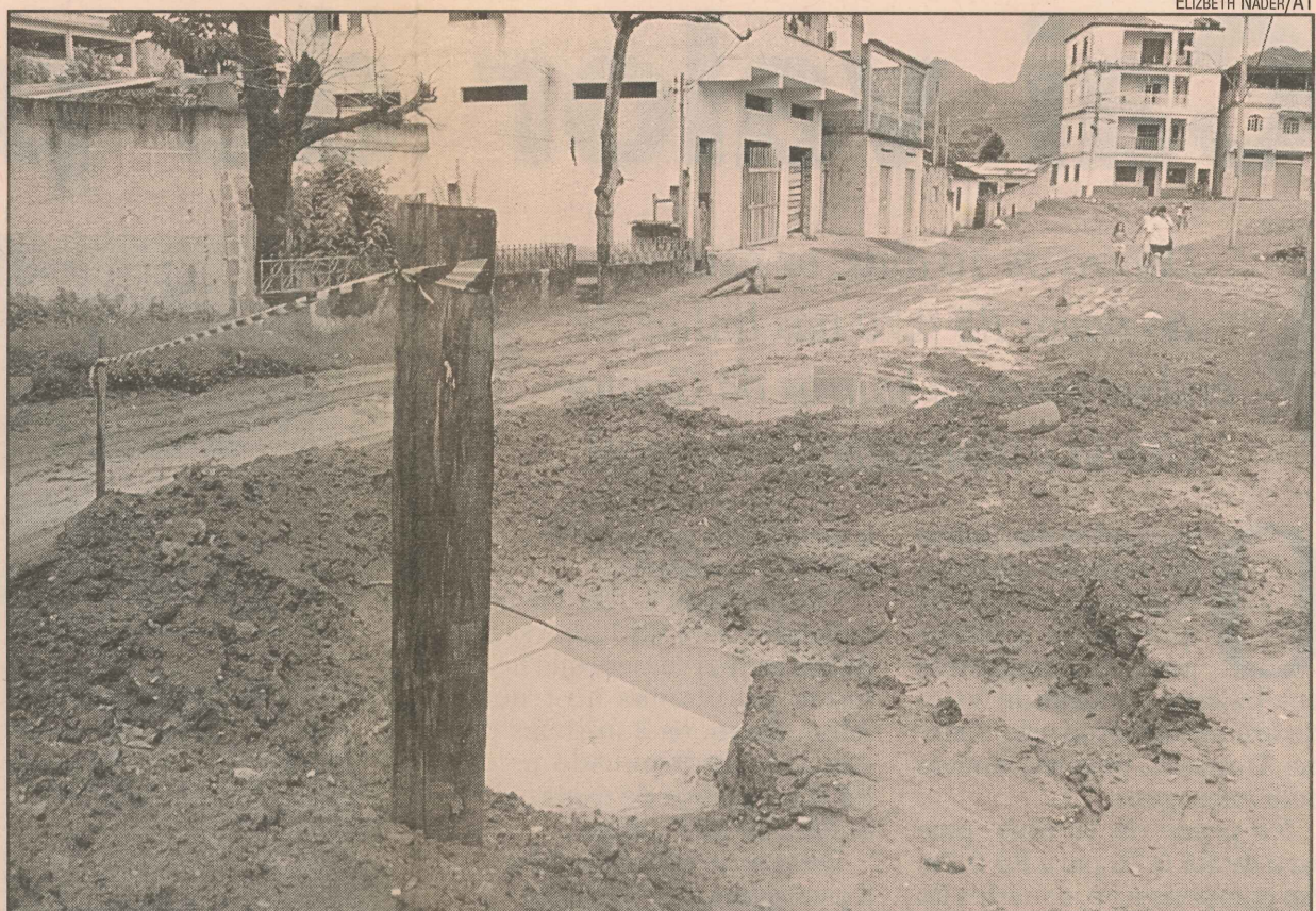
Quando chove, as ruas de Piranema ficam alagadas, com lama e buracos

O secretário de Obras foi procurado pela reportagem de A Tribuna na segunda-feira e ontem pela manhã, mas não foi localizado para falar sobre a falta de pavimentação das ruas de Piranema.