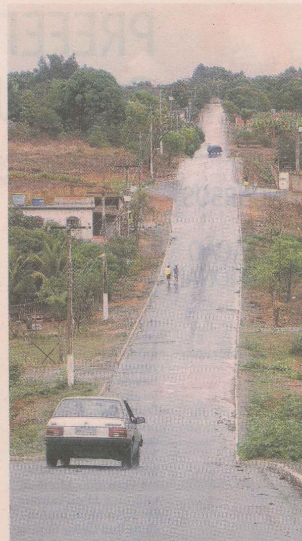
MOBILIZAÇÃO. A Avenida Virgílio Francisco Schwab é um exemplo do poder de mobilização da comunidade de Porto Belo.